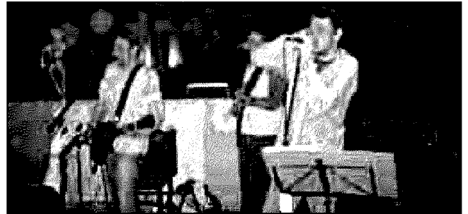
I Qnsb si esibiranno domani a Felina