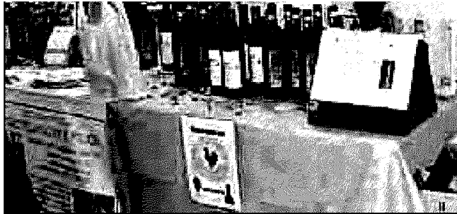
Slow Food a Castelnovo Monti

Oggi le anteprime e domani via alla due giorni delle Città Slow