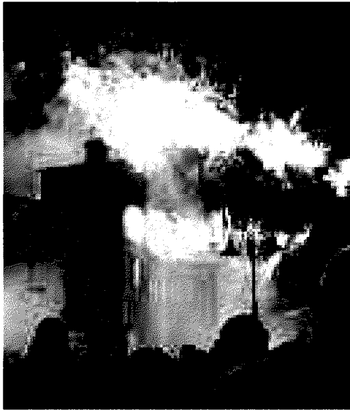
L'incendio del castello a Soliera

SOLIERA. Come da tradizione l'avvio della stagione estiva solierese è segnato dalla "Fiera di San Giovanni", un evento che quest'anno raggiunge il considerevole traguardo delle 157 edizioni. «Nonostante la crisi - spiega il sindaco - il programma è ancora una volta ricco e coinvolgente grazie alla capacità delle numerose associazioni di volontariato del territorio, prima tra tutte la Compagnia Balsamica, e al sostegno degli sponsor che capiscono l'importanza della valorizzazione di questo evento». La Fiera verrà inaugurata stasera alle 20, con la presentazione della "rampa Papa Giovanni XXIII", una nuova opera che completa il recupero delle mura del Castello Campori sul lato est di via 25 Aprile. Subito ci sarà spazio per il concerto gratuito in piazza Lusvardi di "Giuliano Palma & The BlueBeaters" e per il primo appuntamento degli "Incontri con l'autore", con la giornalista Caterina Soffici, che presenterà il suo ultimo libro "Ma le donne no. Come si vive nel Paese più maschilista d'Europa". Domani il programma prevede lo stralunato e divertente concerto-spettacolo della "Banda Osiris" e l'incontro con Bruno Contigiani , il guru del vivere con lentezza , mentre sabato ci sarà spazio per le risate in piazza con la